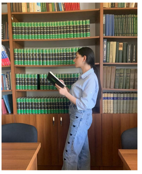
զգացի հենց այդ պահից, երբ արդեն համապատասխան փաստաթղթեր էի հանձնել համալսարանին:

Մի քանի ամսից կավարտեն բակավորի չորրորդ կուրսը: Այս չորս տարիները նույնքան լի էին տպավորություններով, որքան դպրոցական տասներկու տարիները: Սիրելի համալսարանին հրաժեշտ տալու մտքից սիրտս թախիծով է լցվում, ու ես արդեն հազարերորդ անգամ մտքով գնում եմ անցյալ: Առաջին ուսումնական տարում, երբ ընկերուհուս ուղեկցությամբ եկա ու հայտնվեցի համալսարանի բակում, մտքովս մի բան անցավ. «Ի՞նչ գեղեցիկ շենք է և ի՞նչ ընդարձակ բակ»: Տասնութամյա աղջկա համար, իհարկե, շատ տպավորիչ էր նույնիսկ սանդղեքների իրար հաջորդող շղթան, որ բարձրացրեց ու տարավ երրորդ հարկում գտնվող մի կոկիկ սենյակ: Պատին փակցված գրությունն, իհարկե, հուշեց, որ դեկանատն է, և ես, մի քանի անգամ շունչ քաշելով, բացեցի դուռը: Ես արդեն գիտեի, որ ընդունվել եմ, բայց ինձ ուսանող